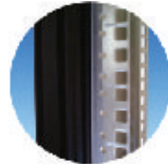
マウントフレーム拡大写真